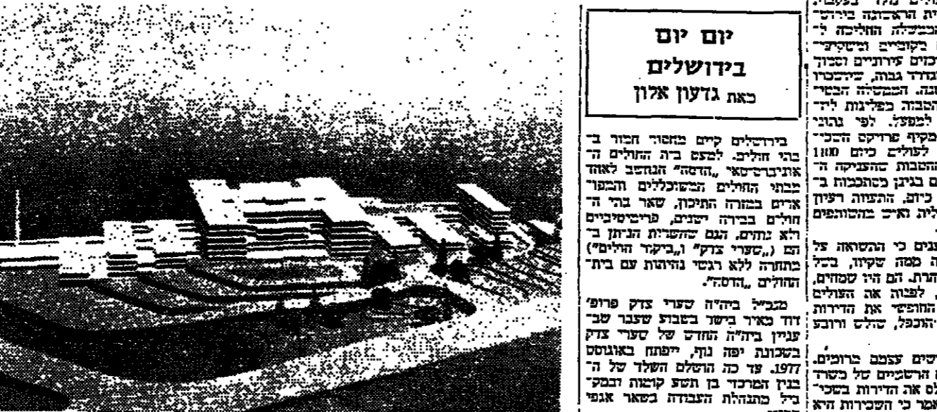
דגם המיזן החדש של שתי בתי חולים.

בבית החולים... צפיפות בבתי החולים בבירה... המיזן החדש של שתי בתי חולים.